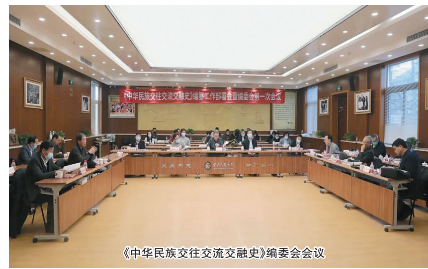
《中华民族交往交流交融史》编委会会议